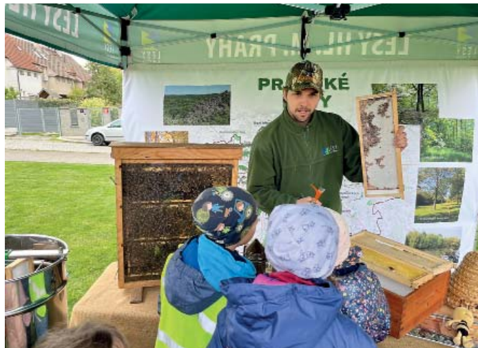
K největším atrakcím povedeného ekologického dne patřily prezentace včelařů a sokolníků.

s detaily každodenní práce lesníků, včelařů a sokolníků. Zblízka poznali techniku, kterou disponuje firma starající se o zeleň a čistotu v Praze 4, včetně profesionální americké sekačky a moderní vysávací čtyřkolky, nebo se sebezvěděli v nejnovějších trendech třídění odpadů. Především děti si vyzkoušely mobilní planetárium a pobavily se u divadélka – hrané pohádky. (red)