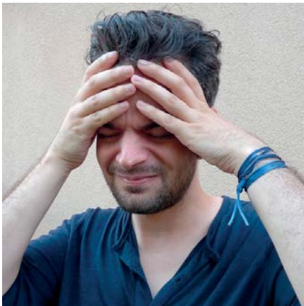
Světový den boje proti nádorům mozku je příležitostí, abychom se dozvěděli více o této nemoci, vyjádřili podporu pacientům a jejich rodinám a podpořili výzkum a vývoj nových léčebných metod.

Nádorové onemocnění mozku bohužel patří mezi nejzávažnější a nejagresivnější typy rakoviny. Každý rok je