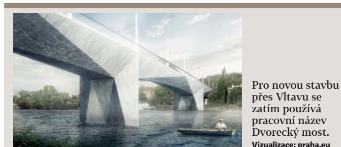
Pro novou stavbu přes Vltavu se zatím používá pracovní název Dvorecký most.

Podolský most tak bude splňovat nejen svou primární funkci dopravní stavby, ale jeho okolí má také fungovat jako místo lákající k trávení volného času. Zároveň se stane cílem obdivovatelů současné architektury a umění. (red)