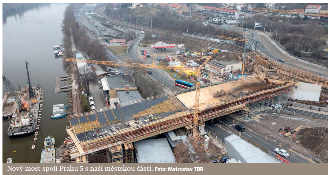
Nový most spojí Prahu 5 s naší městskou částí.

Praha 4 se na uzavírku Podolského nábřeží připravuje. V ulici Jeremenkova, na Modřanské směrem k Barrandovskému mostu a v ulicích Vrbova a Ke Krči zůstanou až do listopadu zřízeny dočas-