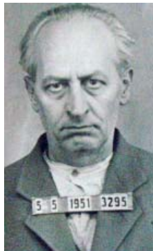
Vězeňská fotografie Antonína Šindeláře.

„Pamětní tabulka Poslední adresa je splátkou našeho dluhu vůči člověku, který v dnešní Praze 4 žil a pracoval a významně se podílel i na její podobě,“ uvedl starosta Ondřej Kubín (ODS). „Tabulkami s poslední adresou si připomínáme často bezejmenné a pozapomenuté lidi, kteří nepřežili vládu totalitních režimů. Jejich osudy jsou pro nás i mementem. Už nikdy nesmíme dopustit, aby třídní nenávisť dovolovala jedné skupině lidí ničit životy, zdraví a dokonce i zabíjet jiné lidi jen proto, že mají odlišný politický názor a vlastní pílí se domohli ekonomické prosperity,“ dodal.