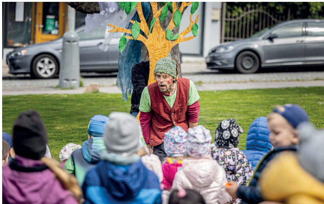
Dětské návštěvníky zaujalo divadelní představení.

Poznání, zábava, hry a především užitečné informace – to byl dubnový Den Země s Prahou 4 na Roztylském náměstí na Spořilově.