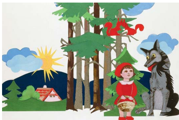
Na výstavě v knihovně Jezerka děti uvidí známé pohádkové postavy.

I v poněkud stísněných bytových podmínkách však neustále pracuje. Na odbyt jdou například její Pražské motivy v pérových kresbách, velký zájem je také o její kresby plzeňské synagogy, slavící úspěch například v Kanadě. Před dvěma lety měla úspěšnou výstavu v rodné Plzni, které věnoval velkou pozornost tehdejší primátor a současný ministr kultury Martin Baxa. „Přemýšlím o další výstavě, možná také o knize věnované jen Praze. Pracovala jsem dlouhé roky v propagaci oddělení Dopravního podniku Metro Praha a tím jsem měla možnost se věnovat výtvarné činnosti na toto téma. Vytvořila jsem první medaile na téma metra i další pro stavební organizace, například Vojenské stavby. Také existuje řada mých obrazů, olejů i kreseb. Jsem vděčná, že díky časopisu Tučňák bude moje tvorba zviditelněna.“