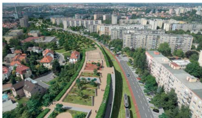
Současný stav a vizualizace budoucích úprav na Spořilovské a v jejím blízkém okolí.

ze Spořilova dále na Jižní Město," uvedl radní Prahy 4 Jaroslav Míth (ODS).