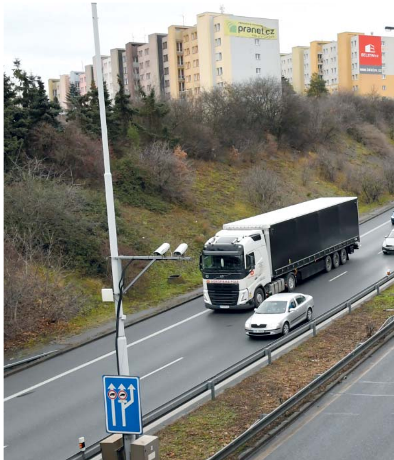
Tranzitní těžká doprava už řadu let ztrpčuje život místním obyvatelům.

Městská část Praha 4 skutečnost, že práce na projektu těžkého zakrytí Spořilovské spojky opět pokračují, vítá, i když podle posledních informací přípravě i stavební práce neskončí před rokem 2030. Zakrytí Spořilovské tak bude dokončeno až po dostavbě Pražského okruhu mezi dálnicí D1 a hradeckou dálnicí, nicméně ten se staví na zelené louce, zatímco na Spořilově se bude stavět za provozu, proto zde stavba potrvá déle.