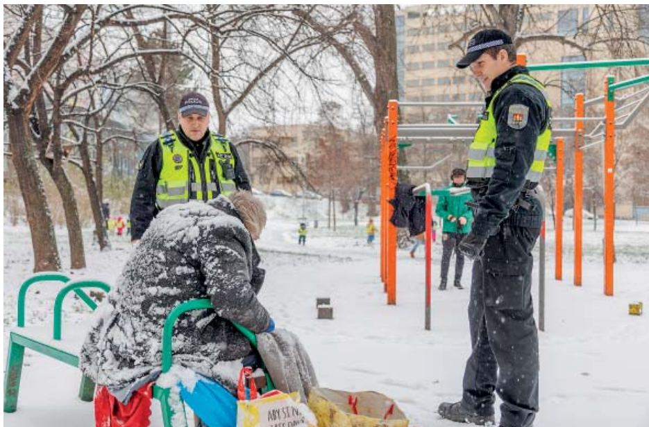
Strážníci poradí lidem bez domova, jak přežít zimní období.

A ž do konce března potrvají zimní humanitární opatření hlavního města Prahy. Cílem je poskytnout pomoc lidem bez domova během chladných zimních měsíců. Hlavní město letos zajistilo více než 700 lůžek v noclehárnách a zařízeních s nepřetržitým provozem na celém svém území. Město zároveň vyzývá veřejnost, aby zůstala všímavá k potřebám osob bez domova a v případě ohrožení života nebo zdraví zavolala záchrannou službu. „Volat můžete i městskou policii na čísle 156. Přivolání strážníci pomou-