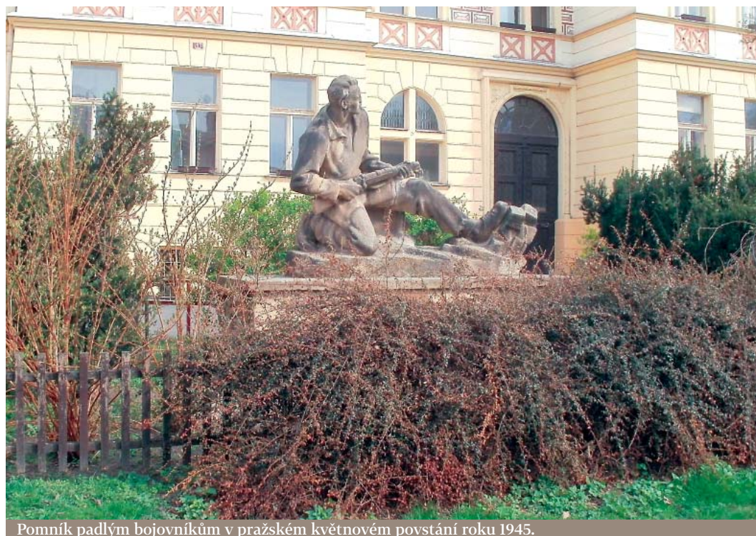
Pomník padlým bojovníkům v pražském květnovém povstání roku 1945.

Právě druhá verze se nakonec ukázala být správnou. Pro časopis Tučňák ji potvrdilo několik pamětníků, obyvatel Podolí i bývalých žáků zdejší školy, mezi