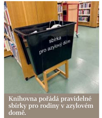
Knihovna pořádá pravidelné sbírky pro rodiny v azylovém domě.

další rodiny. Pro děti pořádáme pravidelné tematické kvízy o drobné dárky. Každý měsíc vyhláujeme také nové téma, ke kterému děti dostanou podklady, a pak jejich práce vyhodnocujeme a rovněž odměňujeme. O seniorech jsem se již zmínila, máme tu vitální dámy s přehledem o životě. Jednou měsíčně proto chceme pořádát setkání seniorů, protože víme, že si chtějí u nás popovídat. Byla tu třeba čtenářka, která prohlásila – když mám blbou náladu, jdu k vám. Starším ročníkům nabízíme také digitální poradnu, učíme je pracovat třeba s WhatsAppem, tabletem nebo zakládat na internetu profily. A od ledna provozujeme donáškovou službu knih našim starším a handicapovaným čtenářům.