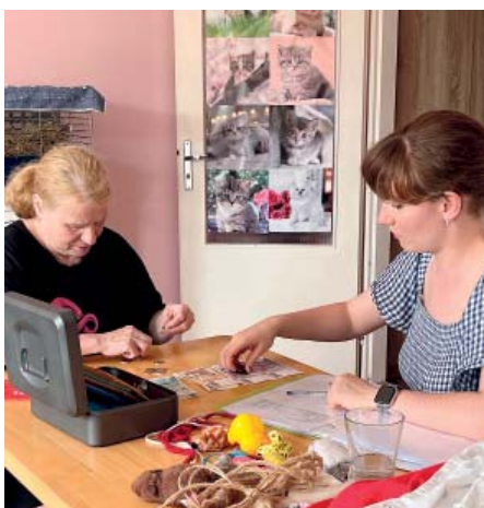
Klienti mají ve svých asistencích oporu a společně třeba spravují domácí finance.