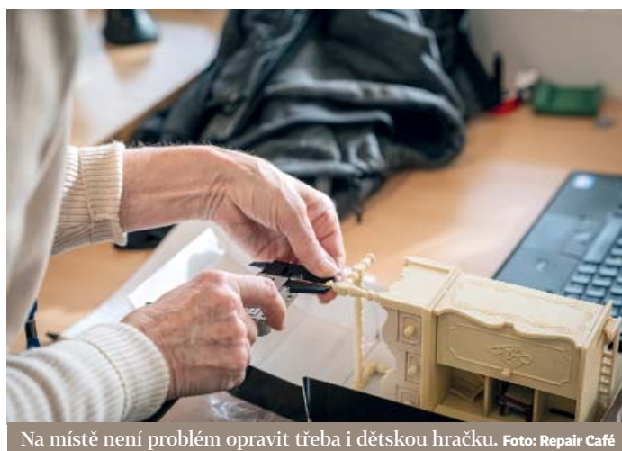
Na místě není problém opravit třeba i dětskou hračku.

Teoreticky opravdu vše, naši mistři jsou velmi kompetentní. Co nás nejvíce limituje, a to hlavně u elektroniky, je často de facto neexistující trh