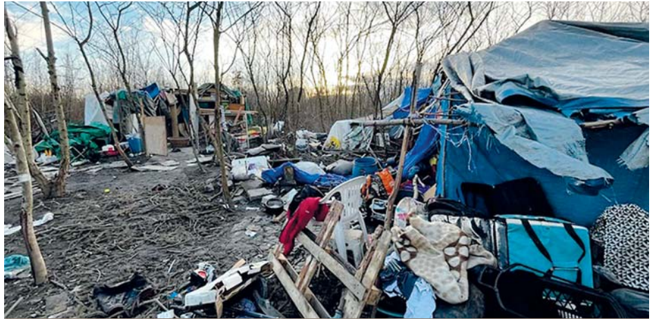
Po lidech bez pevné střechy nad hlavou zbyla velká hromada nepořádku.

Městská část Praha 4 zajistila za garážemi na Spořilově úklid opuštěného ležení lidí bez domova a nepořádku, který tam zůstal. Vychází tím vstříc požadavkům obyvatel, kterým nepořádek ve veřejném prostoru vadí.