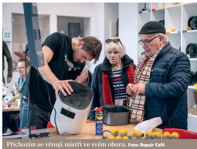
Příchozím se věnují mistři ve svém oboru.