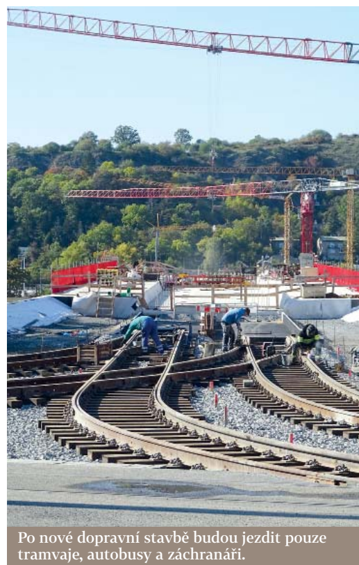
Po nové dopravní stavbě budou jezdit pouze tramvaje, autobusy a záchranáři.

uvedl radní Tomáš Hrdinka (ANO 2011), který je členem místopisné komise. „Komise dlouhodobě upřednostňuje geografické názvy, pokud jsou k pojmenovávanému objektu místopisně relevantní oproti pojmenovávaní po již nežijících osobnostech, které mohou být v proměnách času odlišně vnímány,“ dodal.