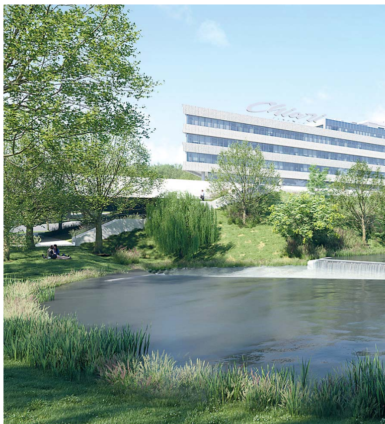
U Nádraží Krč má vzniknout park s rybníkem.

Důležitými stavbami, které mají pomoci zvládnout hustou automobilovou dopravu a vysoké nároky na přepravu cestujících veřejnými spoji, jsou pro Prahu 4 hlavně Pražský okruh – úsek 511, výstavba metra D a rekonstrukce stanice metra C Pankrác, rekonstrukce železnice a rozvoj tramvajových tratí. Nejvýznamnějšími dopravními stavbami, které jsou v Praze 4 v plánu, jsou přitom ty, které podpoří veřejnou dopravu, nikoli tu individuální. Mezi ně patří i právě budovaný Dvorecký most. Více o něm najdete na straně 7.