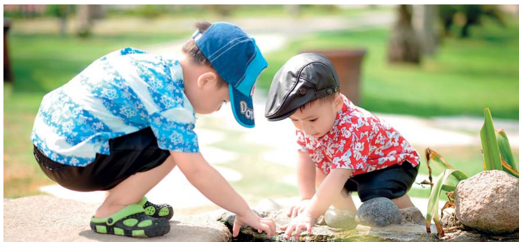
Předškolní vzdělávání se podílí na zdravém citovém, rozhovovém a tělesném rozvoji dítěte i na budování mezilidských vztahů.

Zápisy dětí do mateřských škol zřizovaných městskou částí Praha 4 pro školní rok 2025/2026 se uskuteční 13. až 14. května na pracovištích jednotlivých mateřských škol.