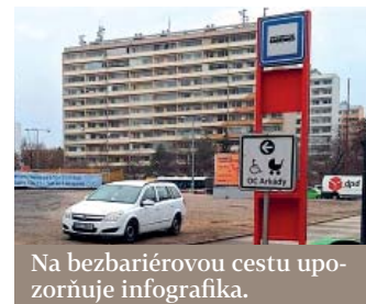
Na bezbariérovou cestu upozorňuje infografika.

DPP uzavřel pro cestující stanici metra Pankrác od pondělí 6. ledna. Omezení potrvá zhruba rok, po který budou vlaky stanic pouze projíždět. Podnik stanicí kompletně zrekonstruuje a propojí s budovanou linkou D.