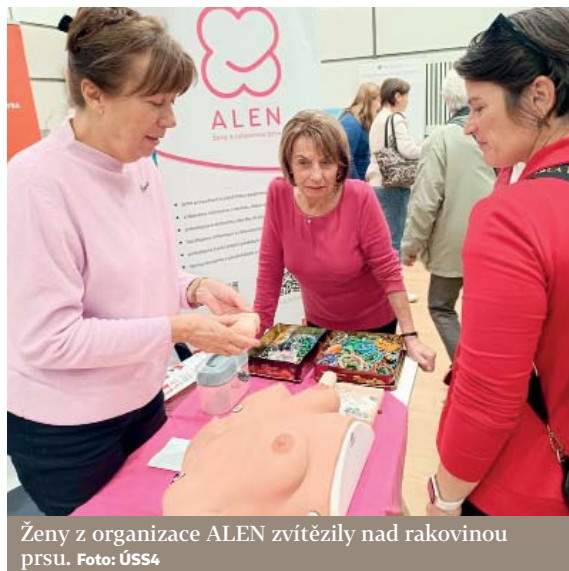
Ženy z organizace ALEN zvítězily nad rakovinou prsu.

Zveme vás na přednášku o prevenci rakoviny prsu, která se koná 27. března od 14.00 hodin v Podolské ulici v rámci aktivit Centra aktivního stáří. Dozvíte se, jak správně provádět samovyšetření, jaké