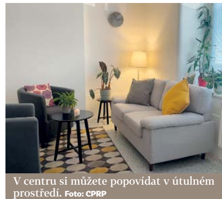
V centru si můžete popovídat v útulném prostředí.