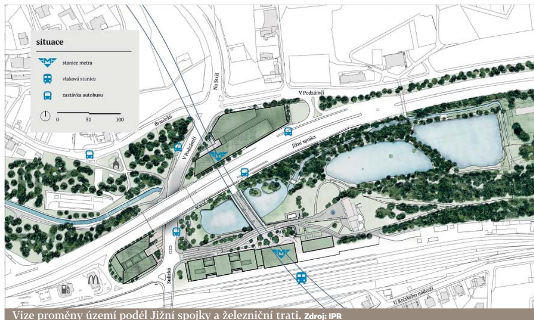
Vize proměny území podél Jižní spojky a železniční trati.

„Spořilovskou jsme chtěli zakrýt již před dvanácti lety. Podařilo se obstarat základní dokumentaci, máme platnou EIA a momentálně dopracováváme povolení, abychom získali stavební povolení a připravili prováděcí dokumentaci,“ uvedl pražský radní a zastupitel městské části Praha 4 Zdeněk Kovářík (ODS). (red)