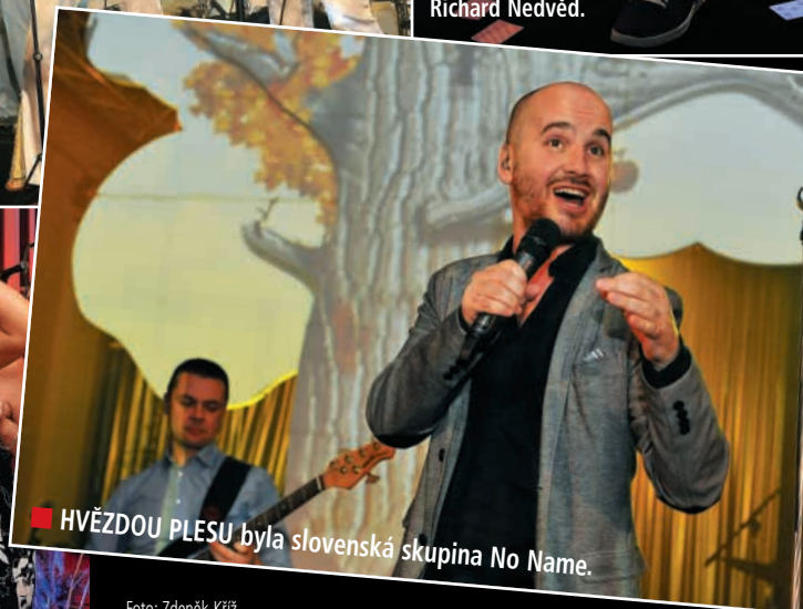
■ HVĚZDOU PLESU byla slovenská skupina No Name.