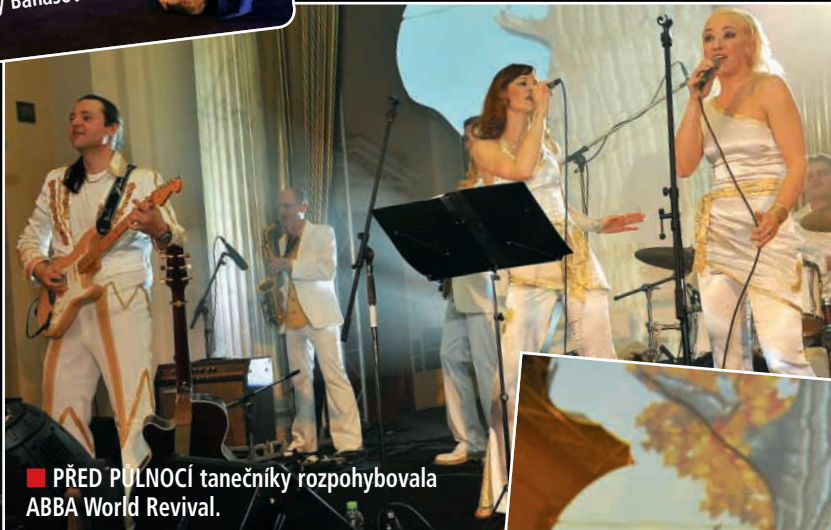
■ PŘED PŮLNOČÍ tanečnický rozpohybovala ABBA World Revival.