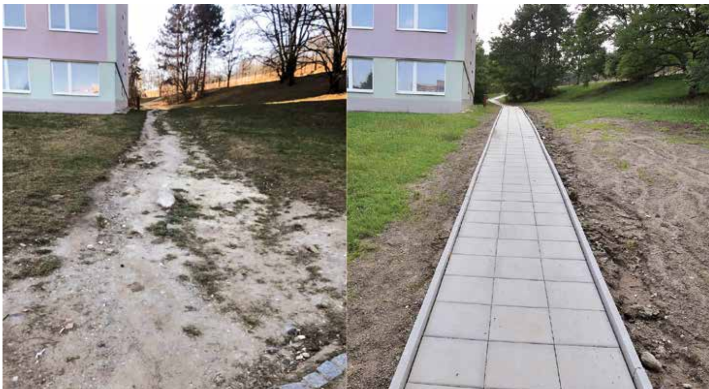
Vzpomínka na loňský ročník participativního rozpočtu, kdy byl například opraven chodník u ZŠ a MŠ Ohradní.

Městská část Praha 4 při schvalování rozpočtu na rok 2023 vyčlenila tři miliony korun na proces participativního rozpočtování. Cílem je zlepšit stav prostředí a fungování městské části a zapojit do plánování a rozhodování veřejnost. Harmonogram a pravidla participativního rozpočtu na letošní rok schválila Rada městské části Praha 4.