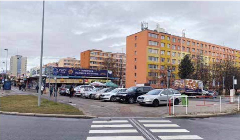
Na místě, kde nyní parkují automobily, má vyrůst předimenzovaná kancelářská budova.

Městská část Praha 4 bude i nadále podnikat kroky proti výstavbě Administrativního centra Budějovická na rohu ulic Budějovická a Vyskočilova, které považuje za předimenzovanou stavbu, nevhodnou do této lokality.