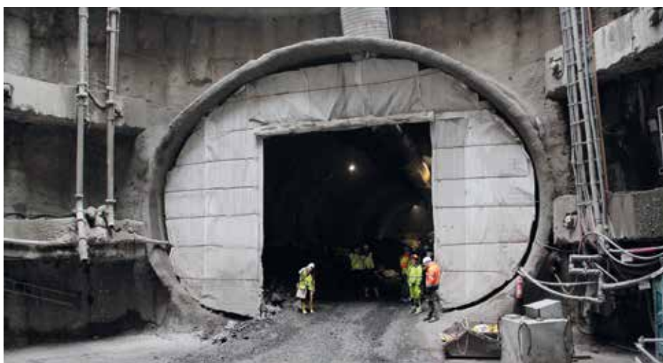
Vstup do štoly