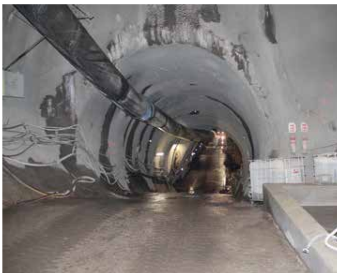
Tunel směr Nusle

Stavba prvního úseku trasy D probíhá v řadě lokalit, které jsou rozloženy kolem ulice Na Strži - od nájezdové rampy na ulici 5. května ve směru do centra až po křižovatku ulic Na Strži a Antala Staška. Zástupci radnice si prohlédli podzemní úsek, který v hloubkách přes 30 metrů navázal na průzkumné štoly a kde se nyní razí již plné profily budoucích tunelů. První úsek trasy D sice bude měřit 1,3 kilometru, nicméně je nutné vyrazit téměř tři kilometry tunelů, což představuje cca 300 tisíc m 3 rubaniny. Pro zajímavost, ta by pokryla celé Václavské náměstí do výšky zhruba sedmi metrů. Dokončení nejen prvního úseku, ale i celého metra D, a jeho zprovoznění se předpokládá na konci roku 2029. (Strabag, md)