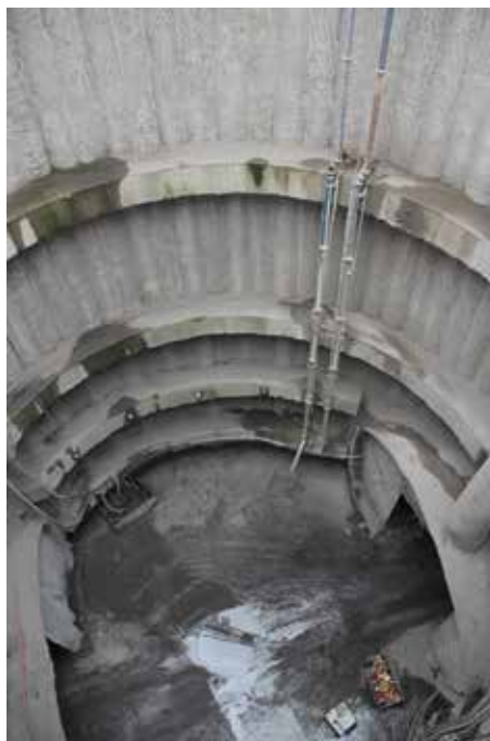
Pohled do šachty