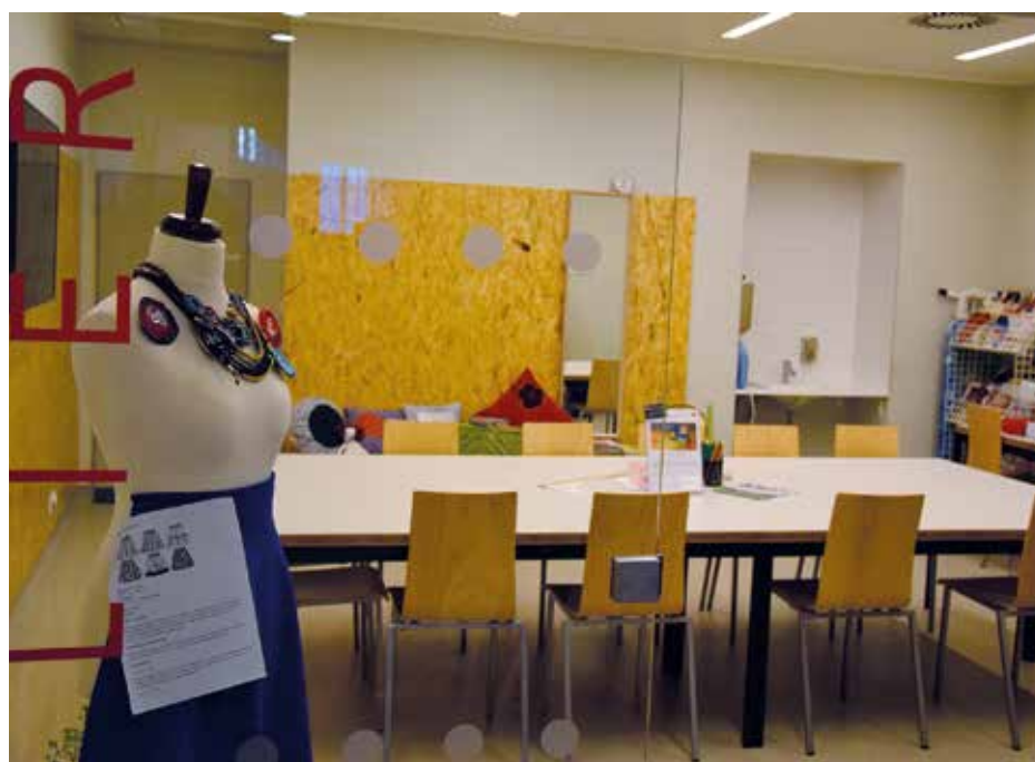
Ateliér Jezerka nabízí možnost ušít si vlastní šaty či tašku.

V Praze 4 se každé třetí úterý v měsíci pořádají v pobočce Novodvorská čtenářské kluby ve spolupráci s organizací Letokruh. A pobočka Jezerka si na sobotu 4. 3. připravila divadelní hru Nožička & Wohryzek, literární detektivku pro děti od 7 let založenou na stejnojmenné knize Marka Tomana. A v úterý 7. 3. se mládež může naučit základy boxu.