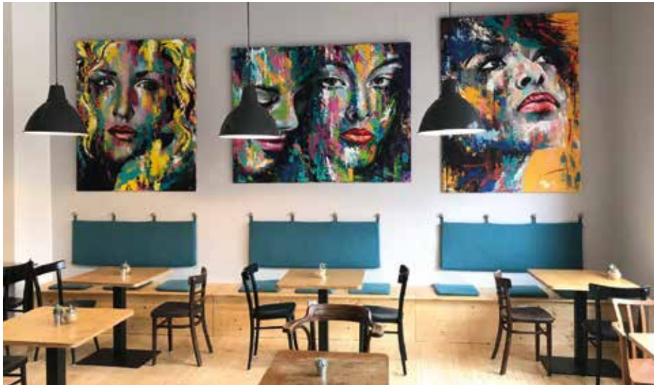
V kavárně se pravidelně pořádají výstavy obrazů.

Přes 40 let žije Mira Košťálková v Braníku, ale teprve zhruba před osmi lety začala tuto část Prahy 4 detailněji poznávat. Tehdy totiž vyměnila náročnou profesi personální manažerky v korporátní firmě za vlastní byznys a v jejím branickém Periferie Café se protínají lidské osudy a vznikají tu nápady, které do slova hýbou celou čtvrtí.