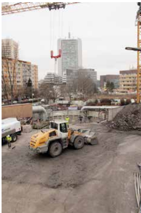
Staveniště u Krčského hřbitova