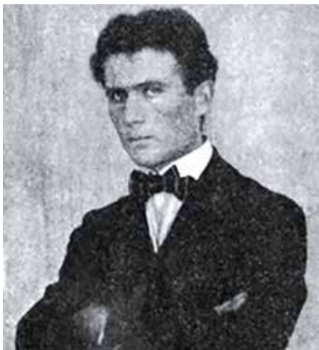
Bohumil Kubišta se vinou španělské chřipky nedožil vysokého věku.

francouzské ponorky Curie v prosinci 1914. Bohumil Kubišta přijel 27. října 1918 na dovolenou do Prahy a jako jeden z prvních se po vyhlášení samostatného státu přihlásil do československé armády. Krátce nato však onemocněl a zemřel na španělskou chřipku ve věku 34 let. Zanechal za sebou 128 olejů a pastelů, v nichž převládala dvě ústřední témata - autoportréty a zátiší - a svou tvorbou inspiroval mladou meziválečnou generaci. Zajímavost: Během svého života Bohumil Kubišta doslova počítal každou korunu. Ovšem v roce 2022 se jeho obraz Staropražský motiv jako první obraz v Česku vydražil za víc než 100 milionů korun. Kupec za něj zaplatil 123 milionů korun... (md, Wikipedie)