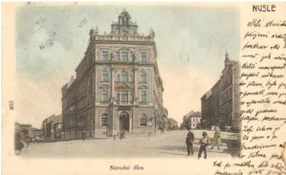
Nuselský Národní dům na snímku z roku 1905.

„...a stav se ve spořice na Synkáčích“. Kdysi a vlastně i dnes hojně užívaná věta obyvatel Nuslí, když mluví o rohovém domě, kde byla desítky let místní pobočka České státní spořitelny a banka je tu i nyní.