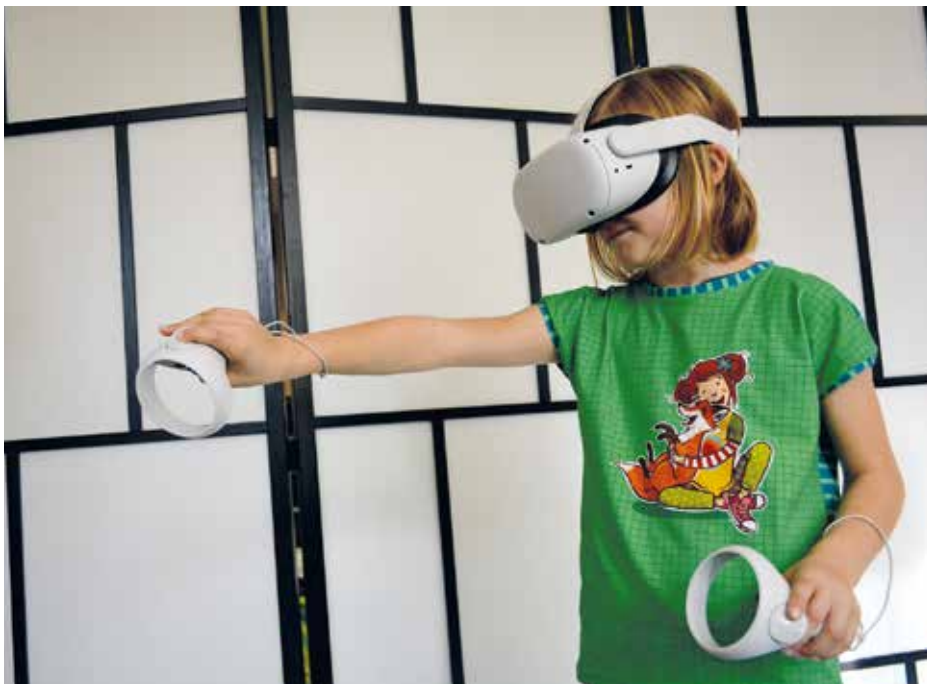
V některých knihovnách si lze vyzkoušet i virtuální realitu.