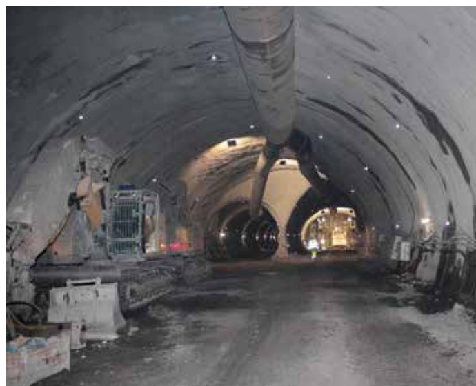
Tunel směr Olbrachtova