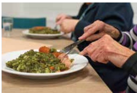
Polední jídlo nabízejí našim seniorům i základní školy zřizované Prahou 4.

Zájemci o dovoz obědů se hlásí u příslušné sociální pracovníce pečovatelské služby, jedná-li se o nového zájemce, nebo u příslušné koordinátorky, jedná-li se o stávajícího uživatele pečovatelské služby. Obědy jsou zajišťovány od externích dodavatelů a na přání je možno objednat dovoz dietní stravy. Cena obědu je v současné době 95 Kč a 40 Kč za dovážku, nicméně