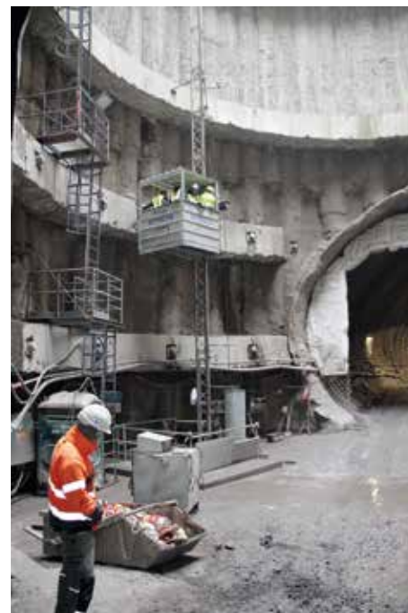
Výtah pro dopravu osob