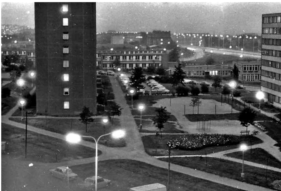
Večerní sídliště Michelská po dokončení, v pozadí Základní škola Bítovská a mateřská škola.