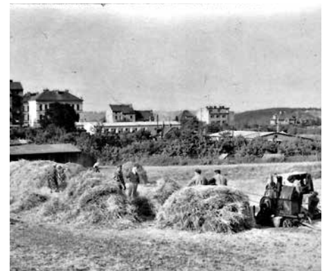
Práce na poli.