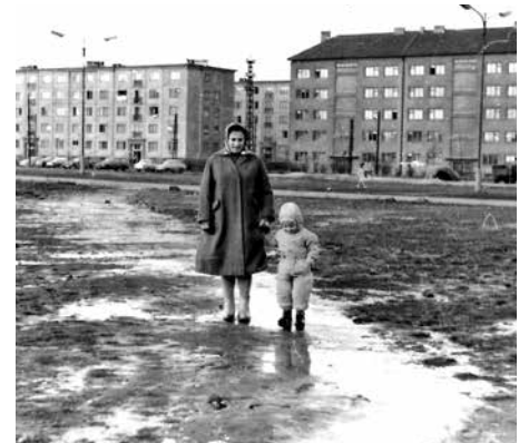
Žena s dítětem stojí v místě dnešní stanice metra Budějovická, v pozadí jsou lampy v Olbrachtově ulici a domy v ulici Pacovská.