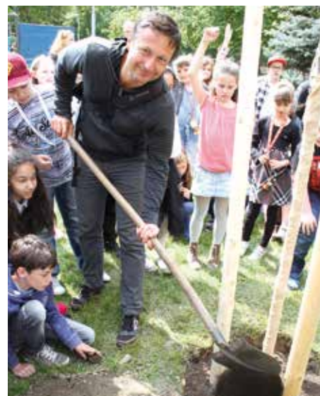
Žáci ZŠ Táborská společně se starostou sázeli na náměstí Generála Kutlvašra slivoň sakuru.