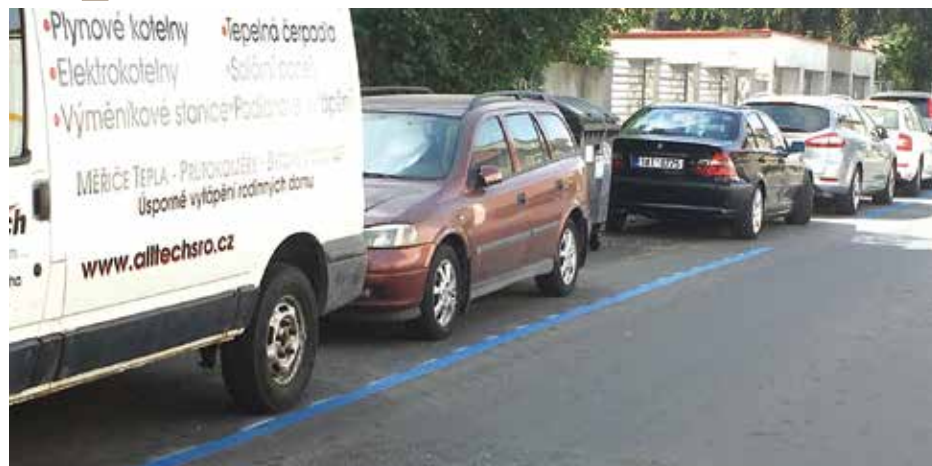
Modré čáry jsou již namalovány a 1. července vstoupí v platnost.

Zóny placeného stání budou na území městské části Praha 4 spuštěny 1. července, výdej parkovacích oprávnění bude zahájen 4. června v těchto výdejních: CZECHpoint v budově Úřadu městské části Praha 4 na adrese Antala Staška 2059/80b, Informační centrum městské části Praha 4 na nám. Hrdinů 1634/3 a Detašované pracoviště Úřadu městské části Praha 4 na adrese Jílovská 1148/14. Dne 18. června bude dále otevřena velká registrační místnost o dvaceti přepážkách v budově historické radnice Prahy 4 na adrese Táborská 500/30. Aktualizované informace o výdejních parkovacích oprávnění budou k dispozici na www.praha4.cz . Upozorňujeme, že platby