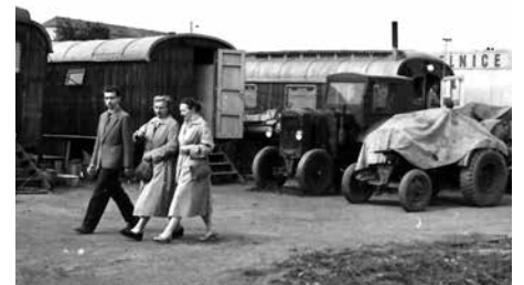
Stanoviště maringotek a pouťových atrakcí.