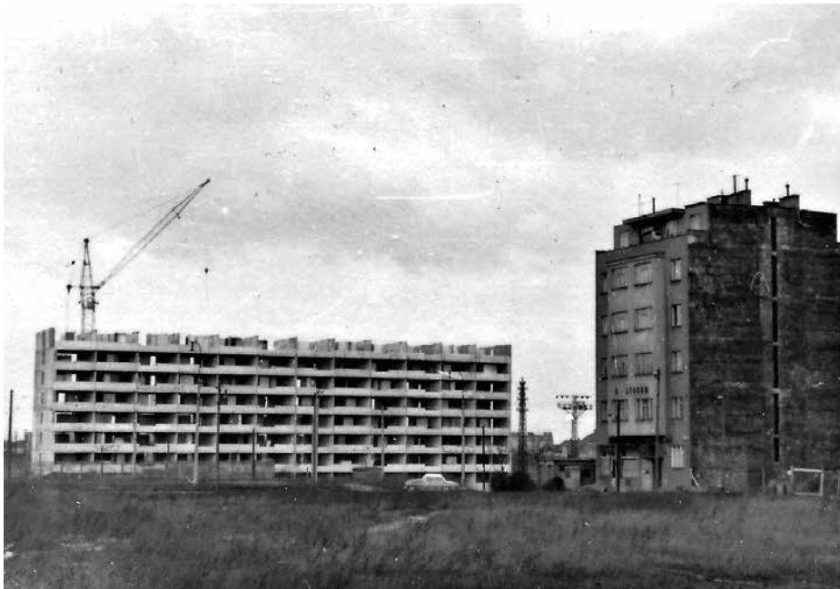
Začíná stavba sídliště Michelská. V popředí dům s obchodem, později hospodou „Za lískem“, v němž se odehrával film „Tam na konečné“.

Výhodná byla i poloha. Tramvaj nám stavěla před domem a přímou linkou jsme jezdili do centra města do zaměstnání i k nádraží. Úžasný byl výhled z pátého patra. Viděli jsme od osvětlovacích stožárů strahovského stadionu přes Petřín Hradčany, v dále Výzkumný ústav matematických strojů, pak Aritmu Vokovice, Vinohrady, Bohnice, věž kostela sv. Václava ve Vršovicích, Malešice, Tyršův vrch i Bohdalec, přistávající letadla ve Kbelích, Satalice i věže v Klánovickém lese. Později nám však výstavba panelového sídliště Michelská v okolí výhled omezila, zůstal nám jen pohled na Petřín, Hradčany a Malešice. Blízké okolí zarostlo stromy. Nicméně je zde, i přes nápor automobilismu, krásně.“