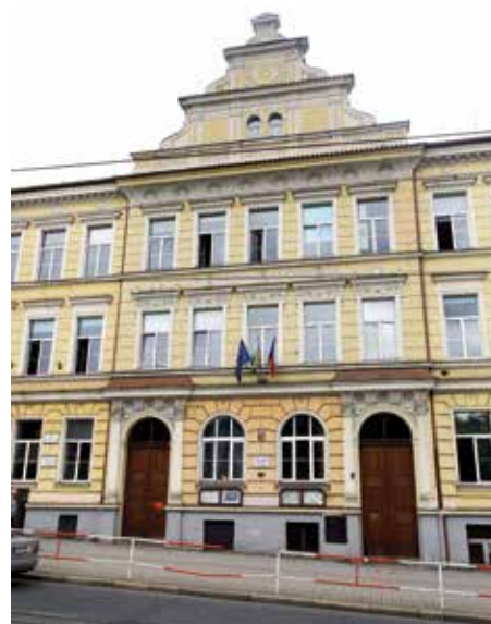
I v ZŠ Tábořská letos uvítají několik desítek prvňáčků.

ho i zakončí v cukrárně. „Jsem rád, že základní škola Tábořská, kde jsem v lavicích prožil sametovou revoluci, je dál plná dětí, takže má