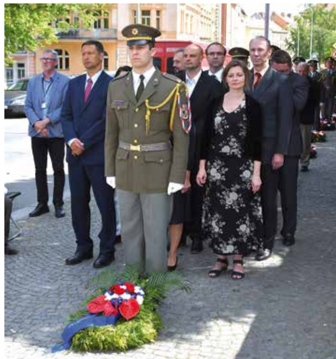
Nám. Gen. Kutlvašra.