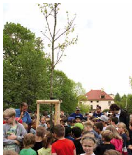
Žáci ZŠ Jitřní vysadili platan javorolistý.