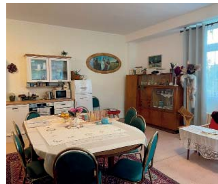
Interiér pobytového odlehčovacího zařízení v Jílovské.

Zaměstnanci ÚSS4 absolvovali školení, kde se naučili pracovat s životními příběhy klientů. „Díky tomu je biografická péče nyní standardem v našich sociálních službách a přizpůsobujeme tomu i prostředí zařízení tak, aby se u nás seniori cítili jako doma. Nejdříve jsme biografickou péči zavedli v terénní pečovatelské službě, kde je již plně ukotvena. Spolu s tím jsme změnilí prostředí Denního stacionáře, kde také