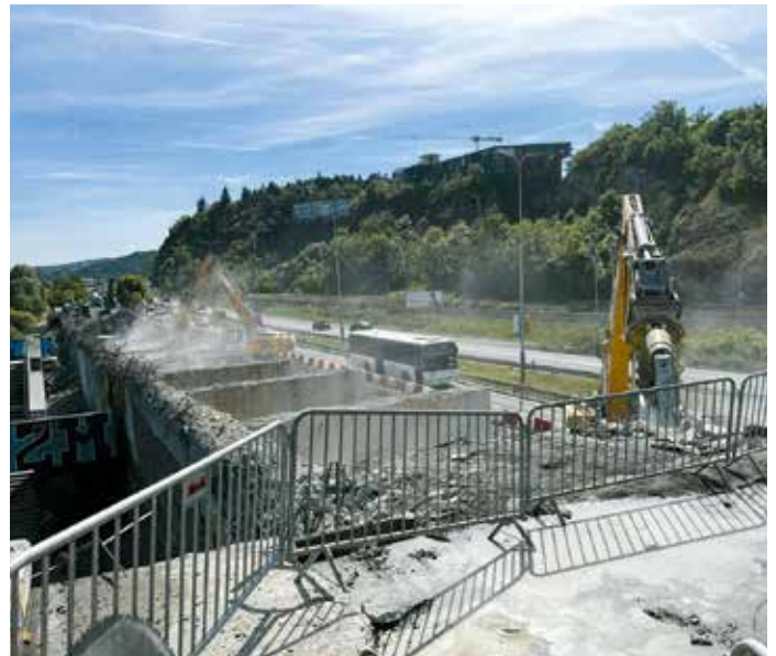
Stavbaři se opět vrací na Barrandovský most a budou v jeho rekonstrukci pokračovat druhou etapou.