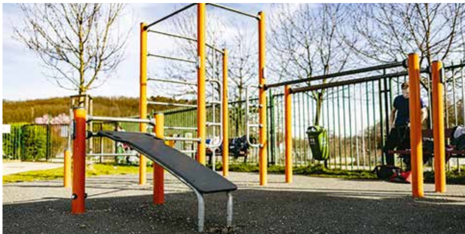
Workoutové hřiště tvoří soustava hrazd, bradel, žebřin a dalších jednoduchých prvků, které slouží ke cvičení zejména s vlastní vahou.

Dvě malé a dvě velké sestavy doplní vybavení současných 10 workoutových stanovišť, která již městská část provozuje. Posilování s vlastní vahou je nejen fenoménem, ale hřiště se stávají platformou podporující zdravý životní styl a v neposlední řadě i sociálním prvkem - místem pro setkávání sportovně založených občanů všech věkových skupin. (red)