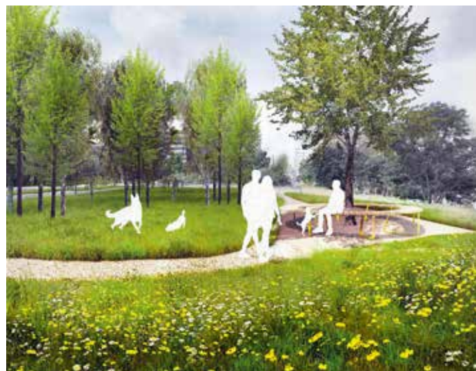
Park obohatí nové volnočasové prvky pro odpočinek i aktivní pohyb.

Jižní část michelského parku V Zápolí čeká v letošním roce revitalizace. Těšit se tak můžete na řadu nových prvků pro odpočinek i aktivní trávení volného času.