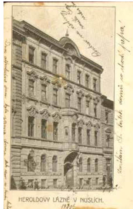
Heroldovy parní a vanové lázně v Otakarově ulici v roce 1906.

V roce 1896 se stal majitelem činžovního domu v Otakarově ulici č. p. 287, hned vedle tehdejší radnice, a kromě bytů zde zřídil také „Heroldovy parní a vanové lázně“. Přestože mu za dvorkem tekli Botič, vodu odebíral z Podolí přes vinohradský vodovod. Parní lázeň stála 30 krejcarů, stejně jako koupel ve vaně I. třídy, vana II. třídy stála 25 kr. Hostům byly v lázních k dispozici dvě komory s inhalacemi, masáží, sedací vanou a sprchy. Nechyběly velký bazén,