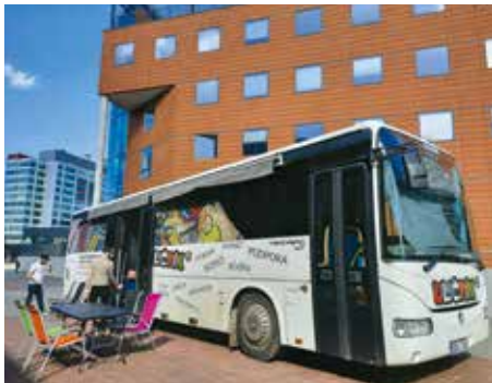
Autobus nabízí služby dětem a dospívajícím od 13 do 18 let.

dětí z různých koutů Prahy 4. Uličník snižuje rizika dospívání, poskytuje informace a nabízí smysluplné trávení volného času. V neposlední řadě také pomáhá dospívajícím s konkrétními problémy a může korigovat naučené rizikové chování,“ uvedla Lucie Michková (ODS), předsedkyně Výboru pro bezpečnost Zastupitelstva MČ Praha 4. Klub je významným projektem prevence kriminality a jediným nízkoprahovým zařízením pro děti a mládež na území městské části Praha 4. Autobus stojí pravidelně každé pondělí před ZŠ Ohradní (13.00–18.00 hod., ul. Pod Vršovickou vodárnou) a každou lichou středu před školou na Jílovské a sudou středu v Poláčkové ulici (13.00–18.00 hod.).