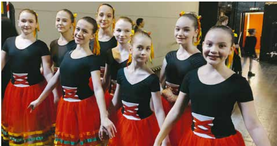
Světové finále soutěže Danza Mundial začíná 21. června i za účasti baletek z Podolí.

Dívky v německém Selbu uspěly se skupinovým tancem Tarantella, který je efektně doplněný tamburínou. Ta dodává nejen osobitý vzhled uskupení, ale navíc také rytmus, který mladé baletky vytváří harmonickým a přesným pohybem. Nyní se dívky pomalu připravují na světové finále. „Všechny se moc těšíme, přijďte nás podpořit ve finále soutěže Danza Mundial,“ vzkazují talentované baletky z Prahy 4. (red)