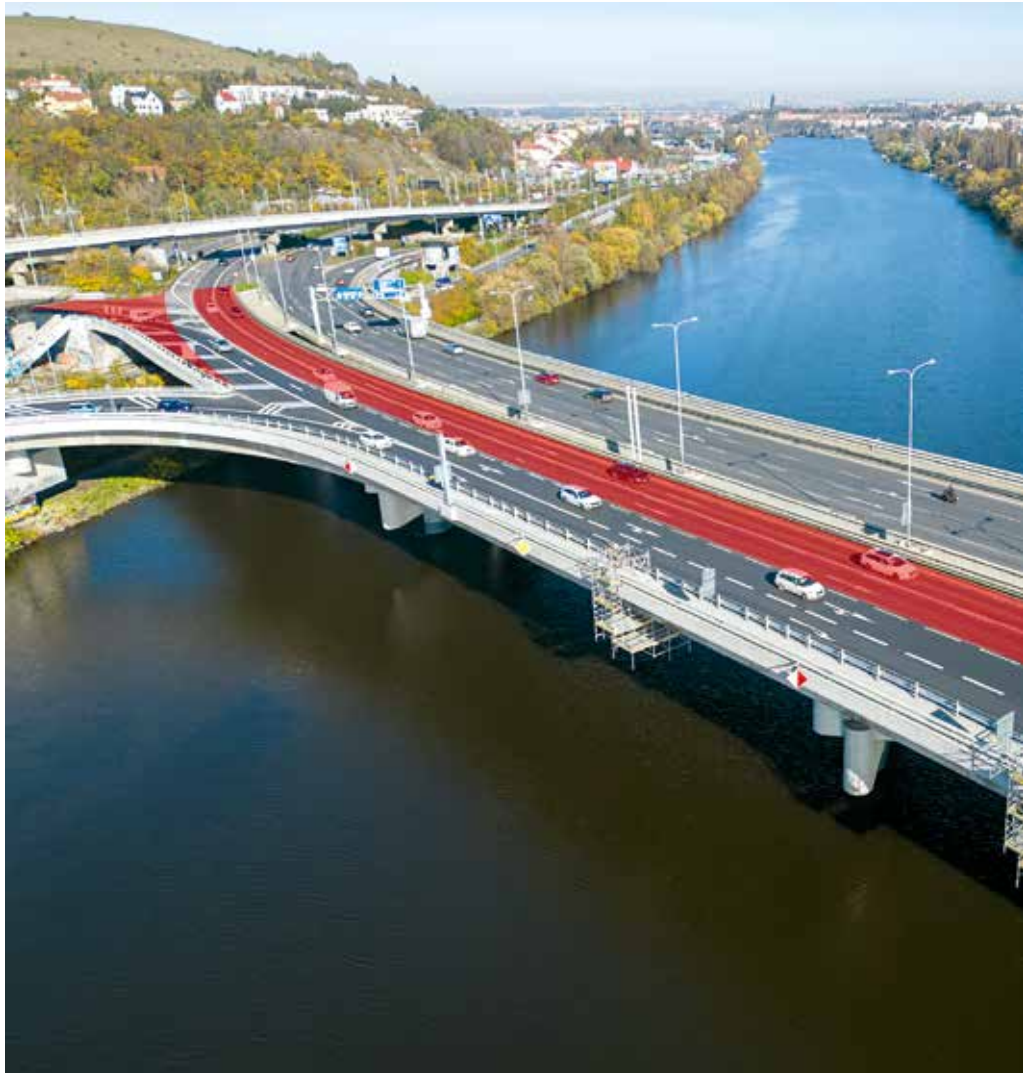
Červeně je vyznačen uzavřený úsek ve 2. etapě opravy mostu. Vizualizace: TSK Praha

„Obyvatele Prahy 4, Pražany i mimopražské řidiče čekají omezení, která jim prodlouží jejich cestu mezi severem a jihem, východem a západem Prahy. Pokud vše dopadne jako v loňském roce, bude zdržení v řádu minut či desítek minut, a to se dá vydržet,“ uvedl radní pro dopravu MČ Praha 4 Jaroslav Míth (ODS). „Bohužel už teď je ale jasné, že letošní dopravní omezení budou ještě rozsáhlejší než v první etapě, takže trpělivost a spolupráci všech, kteří most při svých cestách využívají, bude spolu se zvýšeným úsilím stavbařů nutná,“ upřesnil. Právě letošní etapa je nejtěžší etapou z celé opravy. Mimo samotných prací na mostě čeká stavba rekonstrukce rampy z ulice K Barrandovu, takže nebude možné přímo z této rampy na Barrandovský most najet. Proto řidiči, kteří opravdu tímto směrem na most jet nemusí, by se mu i kvůli svému vlastnímu pohodlí měli