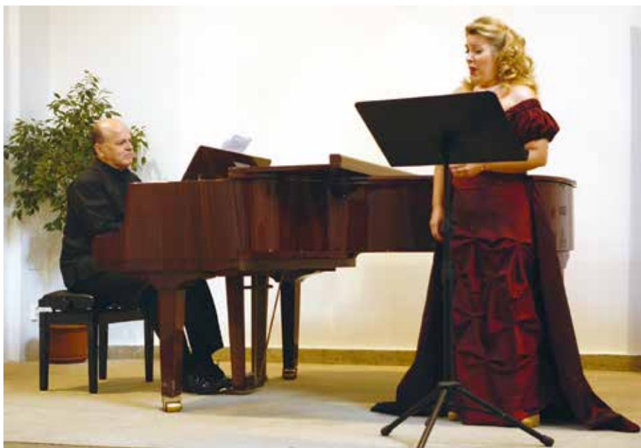
Městská část Praha 4 letos podpoří dotací například mezinárodní hudební festival Tóny nad městy.

Městská část Praha 4 podpoří také v letošním roce dotacemi kulturní, sportovní a spolkové projekty, prevenci rizikového chování dětí a mládeže a jejich bezpečnost, protidrogovou prevenci, ochranu životního prostředí,