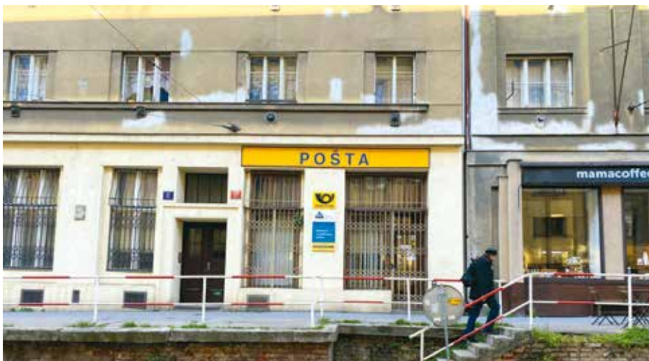
Pošty v Podolí a Braníku mají být podle plánu České pošty trvale uzavřeny.