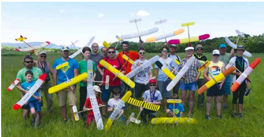
Letecko-modelářský klub z Prahy 4 se pyšní silnou mládežnickou základnou.

Hned dvoje kulatiny letos slaví Letecko-modelářský klub Praha 4. Před sedmi desítkami let byl založen a před 30 roky se natrvalo zabydlel v Hobby centru Praha 4. Jeho současným předsedou je Tomáš Navrátil, který pro Tučňák největší pražský, a možná i celorepublikový modelářský klub blíže představil.