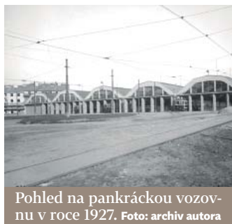
Pohled na pankráckou vozovnu v roce 1927.

Správní rada Elektrických podniků schválila 18. listopadu 1925 společný projekt tramvajové vozovny a autobusových garáží a 6. dubna 1926 se začalo s výkopovými pracemi, celkem bylo přemístěno přes 60 tisíc m 3 zeminy. Práce šly rychle, na stavbě pracovalo 290 dělníků a koncem září již byly hlavní betonové konstrukce. Použilo se na ni 150 vagonů cementu, 27 vagonů železa, 55 vagonů dříví na bednění a 10 vagonů skla, tj. 1 920 tabulí 8 mm silného skla. Vznikla tak prostorná pěti-