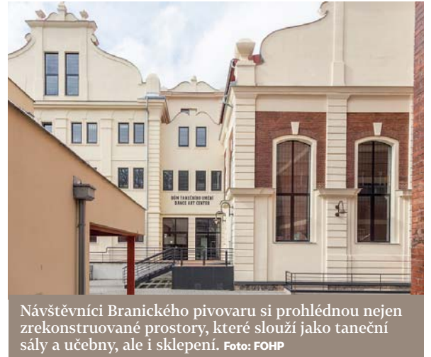
Návštěvníci Branického pivovaru si prohlédnou nejen zrekonstruované prostory, které slouží jako taneční sály a učebny, ale i sklepení.

I letos festival zavítá do Michle, kde se veřejnosti opět zpřístupní areál