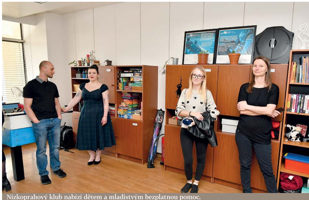
Nízkoprahový klub nabízí dětem a mladistvým bezplatnou pomoc.

Praha 4 má nízkoprahové zařízení pro děti a mládež, klub Doupě. Pomáhat bude hlavně dětem a mladistvým, kteří se nacházejí v nepříznivé životní situaci nebo jsou takovou situací ohroženi. Klub s nízkým prahem znamená, že bude otevřen dětem a mládeži bez nutnosti udávat jméno, věk, adresu či jiné osobní údaje.