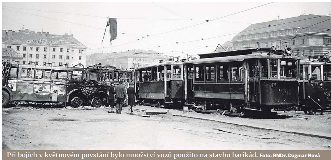
Při bojích v květnovém povstání bylo množství vozů použito na stavbu barikád.

V Nuslích se nachází tři velké areály, největším je vazební věznice, dále Kongresové centrum a vozovna Pankrác. Ta se rozkládá na ploše 27 736 m 2 .