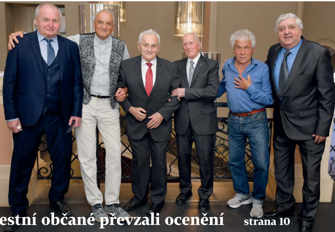
Čestní občané převzali ocenění strana 10