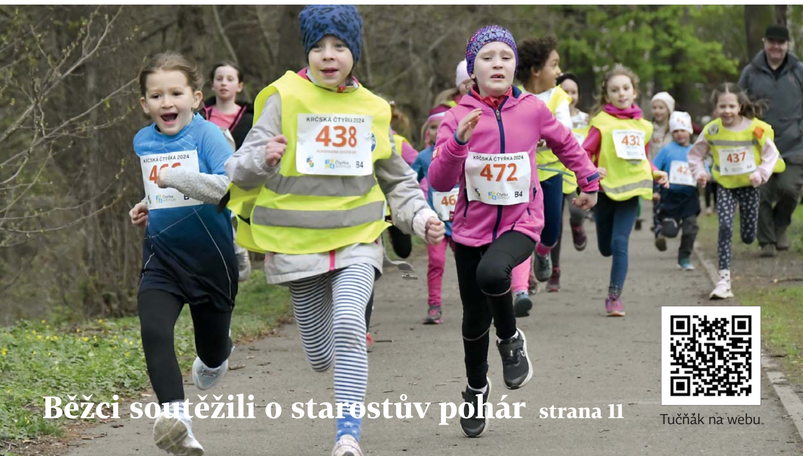
Běžci soutěžili o starostův pohár strana 11