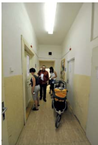
Mnozí si určitě ještě pamatují stísněné prostory v původní budově úřadu v Nuslích.

Při hledání nové budovy tehdejší vedení městské části zvažovalo několik variant, od postavení nové budovy přes koupi existující až po pronájem. Nakonec padla volba na pronájem. Z výběrového řízení vyšla vítězně budova na rohu ulic Budějovická a Antala Staška. Jednou z podmínek přitom bylo umístění úřadu v blízkosti stanice metra, a tedy lepší dopravní spojení pro obyvatele z různých lokalit Prahy 4 při cestě na úřad. Před budovou úřadu a v její bezprostřední blízkosti jsou